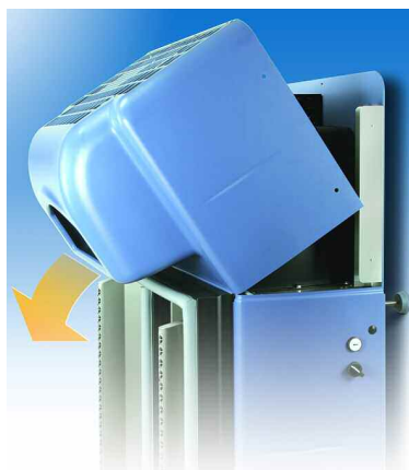
Il pannello arretra rapidamente per un accesso totale