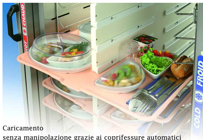
Caricamento senza manipolazione grazie ai coprifessure automatici