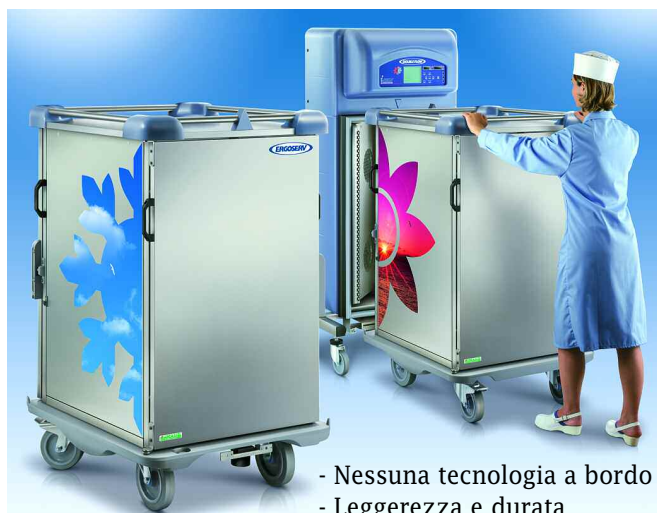
Ergoserv® Junior con opzione Décor