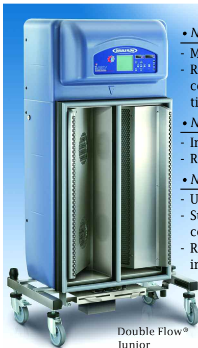
Double Flow® Junior