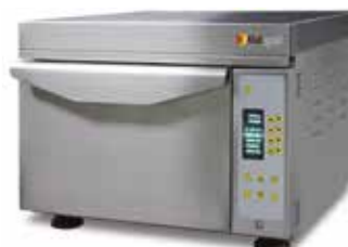
Atollspeed AS 300C