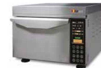
Atollspeed AS 300T