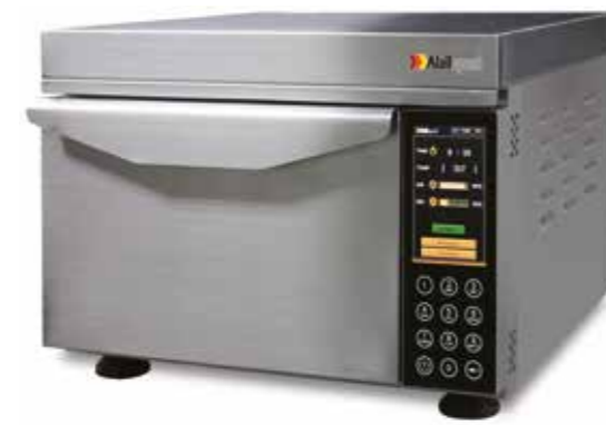
Atollspeed AS 300T

Atollspeed eignet sich ideal für Bäckerei-Filialen, Coffee-Shops, Tankstellen-Shops, Restaurants, Hotel-Bars, Kiosks... Einfach überall, wo Kunden Snacks und kleine Mahlzeiten in kürzester Zeit und bester Qualität erwarten.